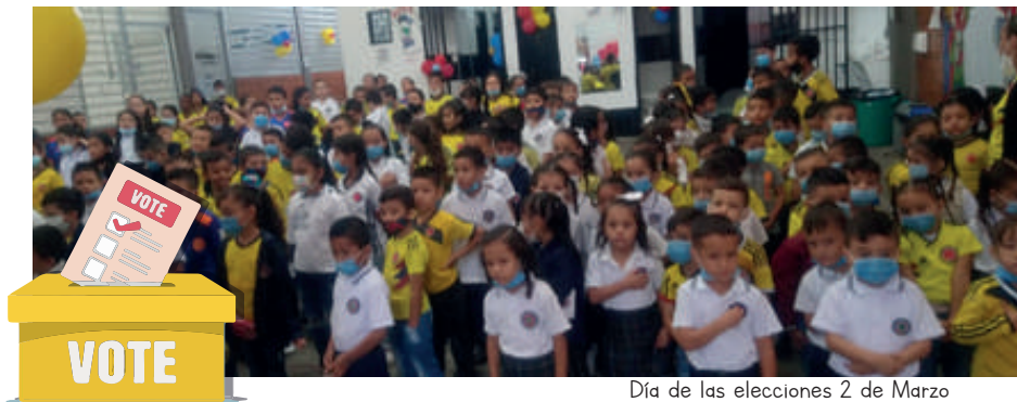
Día de las elecciones 2 de Marzo