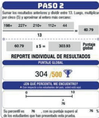
Resultados del colegio

Entre estas estrategias se encuentran las sesiones de pre-icfes los sábados, las clases de competencias ciudadanas en las tardes, el convenio con el SENA para los cursos de inglés, la articulación de la prueba Saber 11 con las estrategias de aula en cada asignatura en el grado 11 principalmente, el fortalecimiento del Plan Lector, entre otras. De igual manera, se espera que los estudiantes asuman su responsabilidad y autonomía, para mejorar sus procesos de comprensión lectora según las estrategias dadas por los docentes.