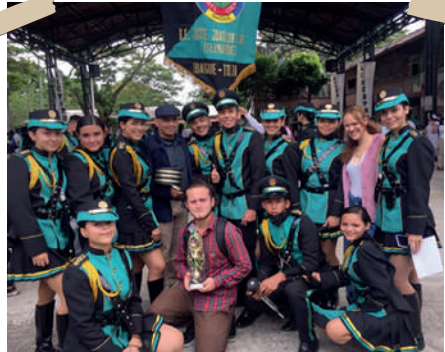
Integrantes Banda Marcial 2022

El día 8 de abril la banda volverá a presentarse el aniversario del Departamento del Tolima en el centro de Ibagué.