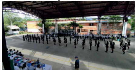
Presentación Banda Marcial Joaquinense.