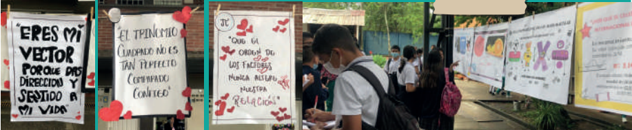
Carteleras, frases a las matemáticas.

Por otro lado, las curiosas frases de amor relacionadas con las matemáticas, cautivaron el interés de quienes las leían.