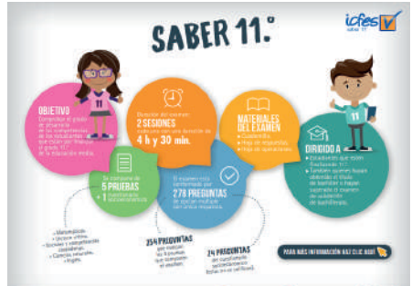
Información de las pruebas saber 11

Referente a este problema, los maestros han diseñado un plan de mejoramiento para fortalecer las habilidades necesarias que aumenten los puntajes.