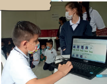
Día de las elecciones 2 de Marzo 2020.

Hubo tensión y competitividad los días previos a la jornada electoral, sin embargo, el apoyo y el aliento hacia los candidatos de los diferentes grupos fue evidente. Todos esperábamos con ansias y anhelo los resultados que definirían nuestros representantes.