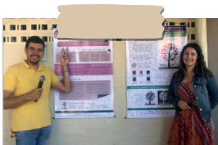
Inauguración y presentación de la emisora